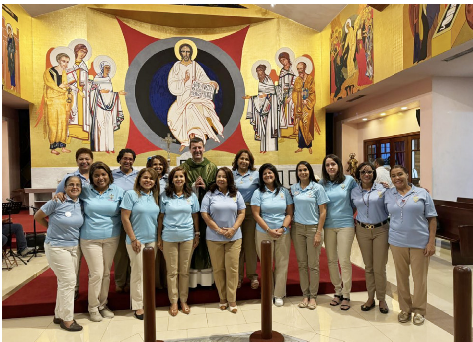
texto Amado Hasbún

Con la participación de los miembros de la Hermandad de Hombres y Mujeres, fue celebrada la misa de envío del Nuevo Equipo Coordinador Parroquial el lunes 14 de octubre del año en curso, a la 6:00 pm. Durante la misma, nuestro Párroco, el Rev. Padre Luca realizó la oración de Envío y pidió al Padre Celestial poner su mirada sobre estas servidoras, para que, fortalecidas en el Espíritu, sean el reflejo del rostro de su hijo Jesús durante el período que les tocará dirigir la Hermandad de Mujeres y las sostenga para que el cansancio no les agobie. Al mismo tiempo oró por las hermanas que culminaban su periodo de coordinación.