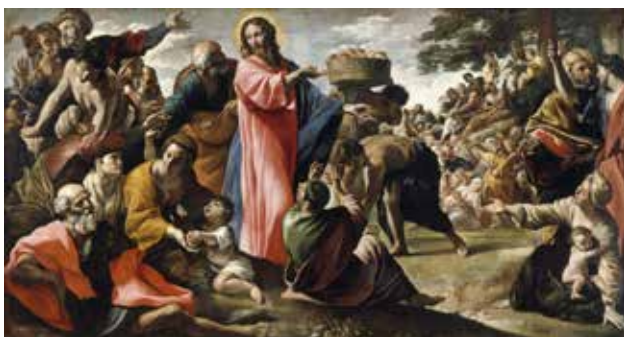
Giovanni Lanfranco. Óleo sobre tela, 1620-1623. Galería Nacional de Irlanda.

E l sueño de un líder político o dirigente comunitario es tener el poder de dar alimento, de manera ilimitada, a todas las personas que lo pidan. Los pueblos necesitan del sustento diario. Esperan siempre que alguien venga en su ayuda. Así ha sido desde siempre.